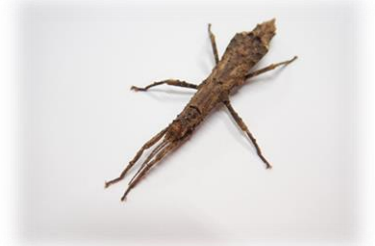
写真：コブナナフシ

皆さんの身近にもナナフシは暮らしているかもしれません。ぜひ幸運な木の枝を探してみてください。