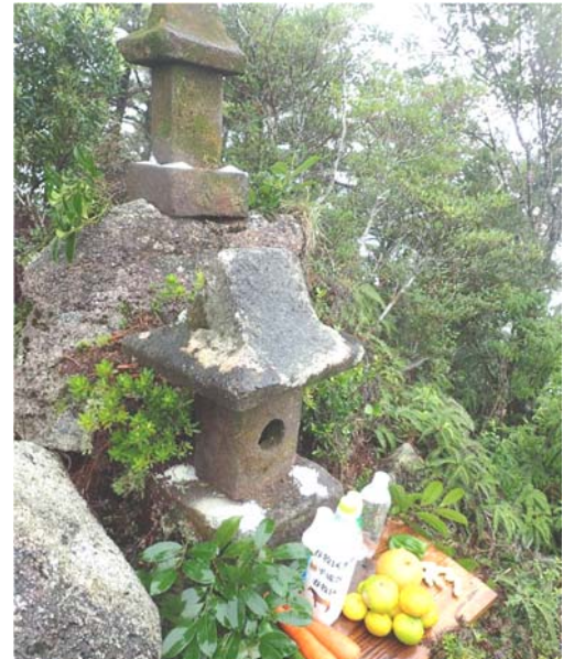
安房前岳の祠、春牧区岳参り時に撮影