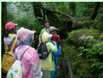
ヤクスギランド観察 木工クラフト ネイチャーゲーム