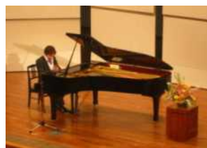
屋久島離島開発総合センター

2回目の夜の部は“ピアノで綴る恋人達への詩”と題し、ラブソングを中心としたプログラム。来場していたカップルの名前をイメージした曲を即興で披露しプレゼント。寒い冬の夜も暖かな気持ちになるコンサートでした。