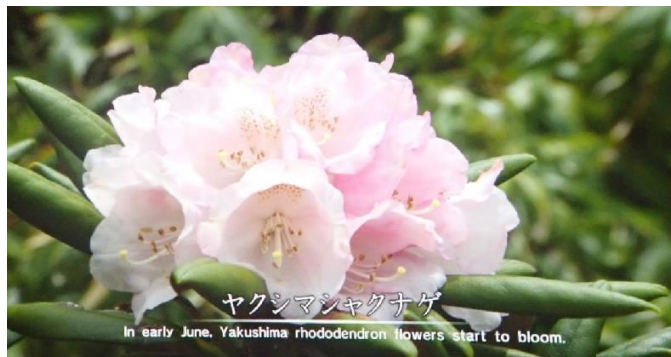
ヤクシマシクナゲ

※ご住所の確認できる身分証明書（免許証、保険証、学生証など）を受付にご提示ください。 （通常料金 大人530円、高校生・大学生370円、小・中学生270円、幼児6歳未満無料）