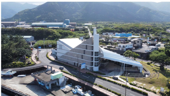
屋久島環境文化村センター (屋久島町宮之浦)

※ 公益財団法人屋久島環境文化財団ホームページ https://www.yakushima.or.jp/