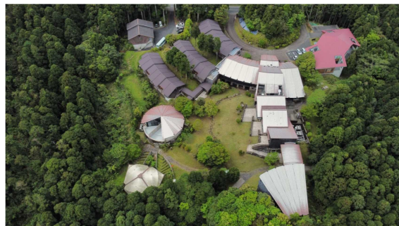
屋久島環境文化研修センター (屋久島町安房)